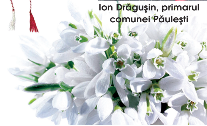
Ion Drăgușin, primarul comunei Păulești